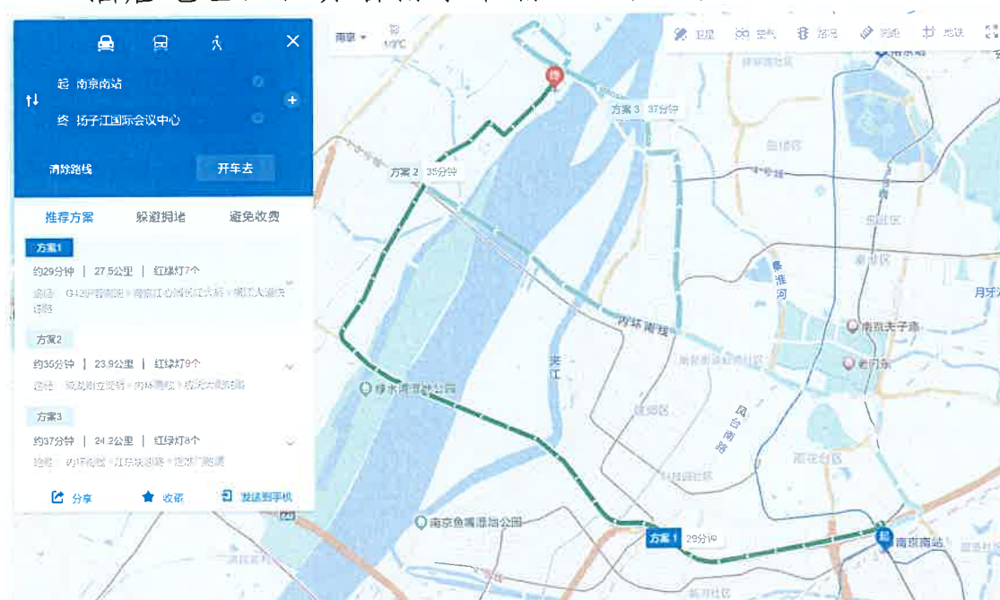
南京南站到会议中心路线